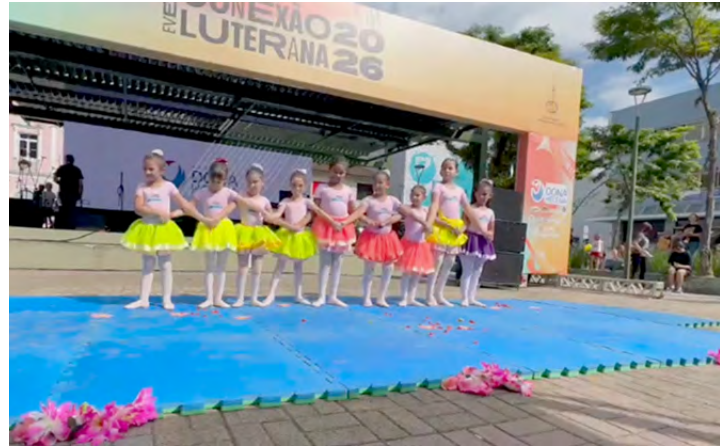
As meninas do balé se apresentaram e encantaram os presentes na Conexão Luterana