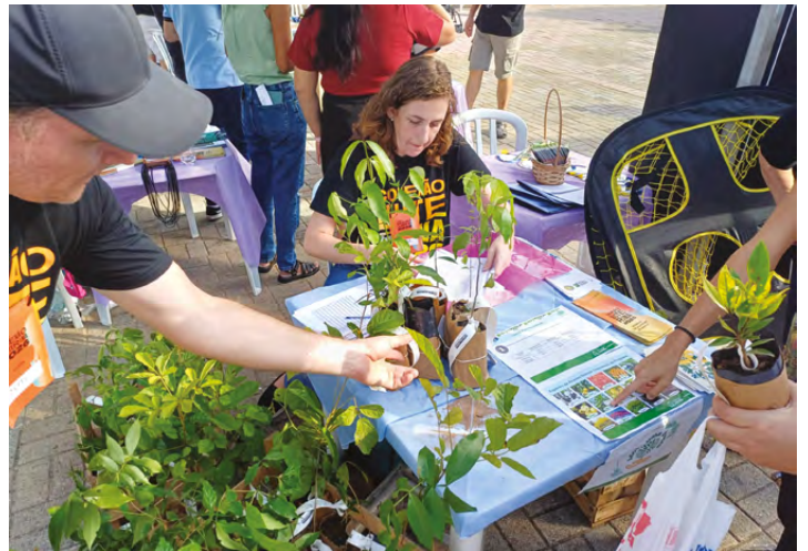
Mudas de árvores foram distribuídas às pessoas que participaram do evento na praça