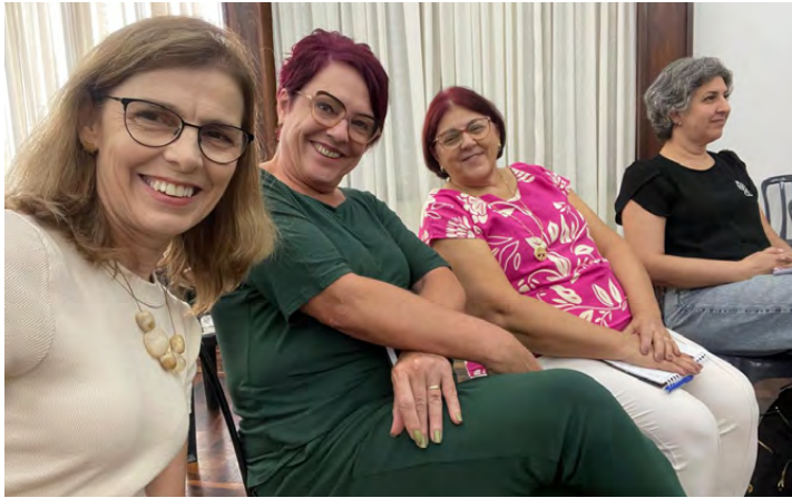
Oficina de formação sobre violência contra a mulher, realizada no mês de abril