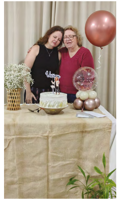
Momento de oração: agradecimentos pelos 25 anos à frente do grupo