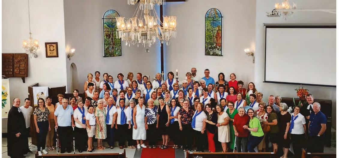
Culto de ação de graças e café especial marcaram o aniversário da OASE Rebeca

Durante a mensagem, baseada nos versículos 1 e 2 do Salmo 90, as pessoas presentes foram lembradas que ao celebrarmos as Bodas de Diamante da OASE Rebeca, precisamos reconhecer que este grupo só chegou até aqui porque Deus tem sido um refúgio, uma morada segura para todas as mulheres que fizeram e fazem parte deste departamento.