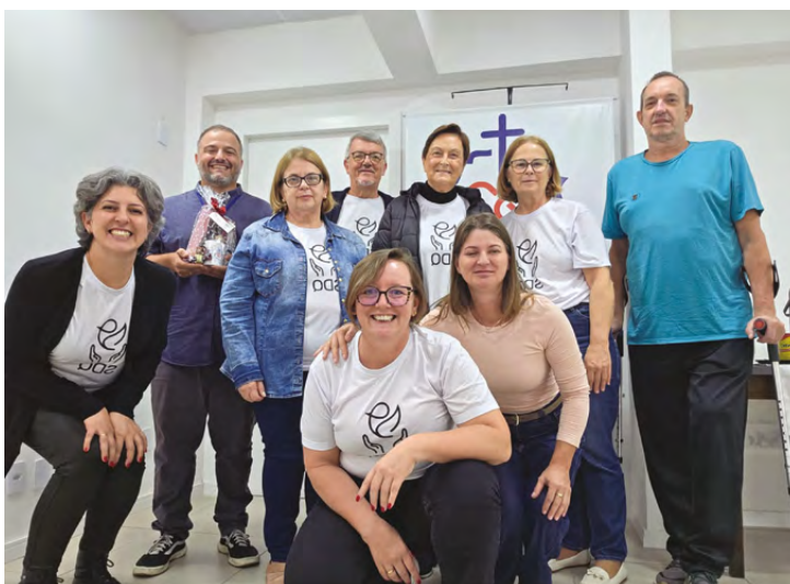
Equipe de Serviço de Dependência Química participou de capacitação sobre codependência

Trata-se de um quadro caracterizado por um distúrbio mental acompanhado de ansiedade, angústia e uma preocupação obsessiva com a vida do outro. O codependente deixa de viver sua própria história para girar em torno dos acontecimentos da vida de quem deseja "salvar". O ponto de alerta é que, em vez de auxiliar na recuperação, o codependente muitas vezes acaba sustentando o ciclo