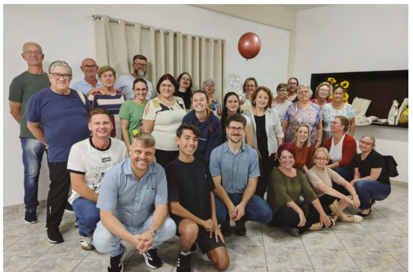
Integrantes do coral celebraram com muita gratidão e alegria a data especial