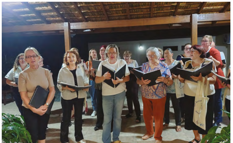
O coral da Unida em Cristo cantou especialmente para sua regente