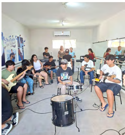
A Banda Missão Criança brilhou ainda mais a inauguração do novo espaço multiuso

As celebrações também tiveram papel central. Em parceria com a empresa Multiplike, foi realizada a inauguração do novo espaço destinado a múltiplas atividades. O evento reuniu alunos, famílias, equipe e representantes da empresa em um momento de integração e alegria, embalado pela apresentação da Banda Missão Criança, formada a partir das aulas de música, iniciativa vinculada a um projeto cultural aprovado pelo Governo Federal.