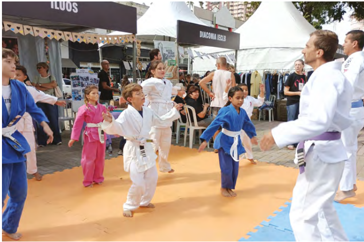
Grupo de alunos do jiu-jitsu demonstraram seus conhecimentos durante o evento